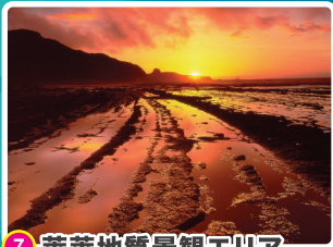
7 菜菜地質景觀エリア