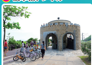
5 トンネル南口休憩エリア