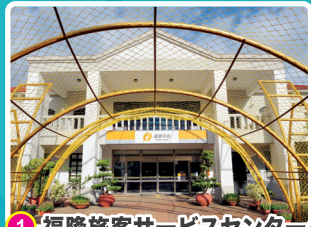
1 福隆旅客サービスセンター

注意： 旧草嶺トンネルへのハイキングは平日しか開放になっていません。休日はサイクリングの人数が多いので、万が一に備えるために、トンネルでは休日の歩行進入はご遠慮ください。トンネル内ではよくしっとり濡れているので滑りやすいから、どうか低速で進むをお願いします。