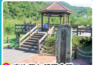
3 吉次茂七郎記念碑