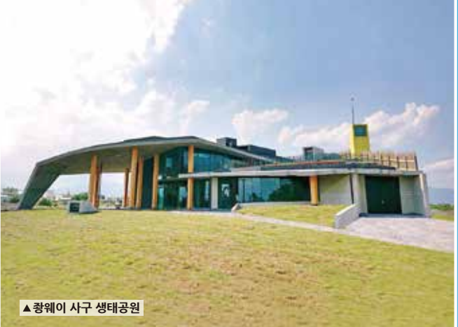
▲ 장웨이 사구 생태공원

장웨이 사구 생태공원 유명한 건축가 황성원은 이란 풍경을 통합하고 추황웨이 해안의 연속적인 모래언덕과 독특한 동식물 생태를 보존하여 관광객들이 방문하고 체험할 수 있는 주요 전시 공간으로 만들었습니다. 현재 전시장에는 방문자 센터, 전시 공간, 상점 및 기타 서비스 시설이 들어설 계획입니다. 아침, 해질녘, 달이 뜰 때 등 언제 오더라도 공원을 산책하고 파도 소리를 들으며 경치를 감상하는 것은 모두 큰 즐거움이며, 이란 국제적인 매력을 보여주는 새로운 볼거리입니다.