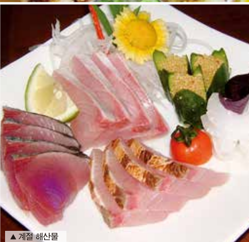
▲ 계절 해산물