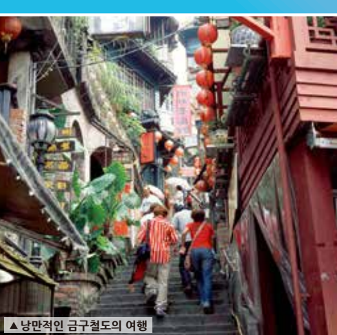
▲ 낭만적인 금광촌의 여행

란강강 하류에 위치한 쑹웨이이에는 풍부한 일조량과 모래 토양이 있어 모든 종류의 과일과 멜론이 자라기에 이상적이어서 멜론의 천국이라고 할 수 있습니다. 멜론이 한창 생산되는 6~7월에는 장웨이진 농민회에서 멜론 축제를 개최하며, 신난 레저 농장, 관지 멜론원 등 지역 내에서도 맛있는 멜론을 즐길 수 있습니다.