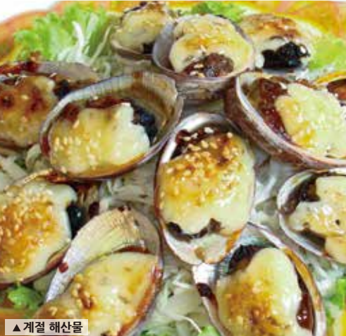
▲ 계절 해산물

동베이자오 해역에는 수산물로도 다양하다. 비터우鼻頭, 룽둥완龍洞灣, 아우띠澳底, 푸룽福隆, 경팡梗枋, 우스항烏石港, 남방아오南方澳는 유명한 해산물시장 집합지로 다양한 대만식 새우, 조개, 활어 요리를 먹을 수 있다. 그중에 비터우와 룽둥완은 전복九孔, 생게海膽, 푸룽과 아우띠는 흑등黑毛, 백등白毛, 오징어軟絲, 터우청과 우스항은 바다가게 海戰車, 남바아오는 청어鯖魚가 특히 유명하다.