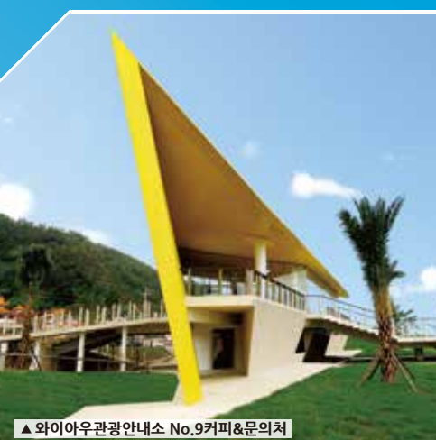
▲ 와이아우관광안내소 No.9커피&문의처

최근 관광여행 품질 향상을 위해 노란색 조형으로 유명한 와이아우 안내소에선 친절한 안내서비스를 제공하여 국내외 여행객에게 친절할 여행환경을 조성해 힘쓰고 있다.