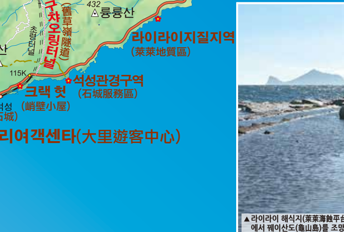
▲ 라이아리 해식지(萊葉海蝕平台)에서 웨이산도(龜山島)를 조망함