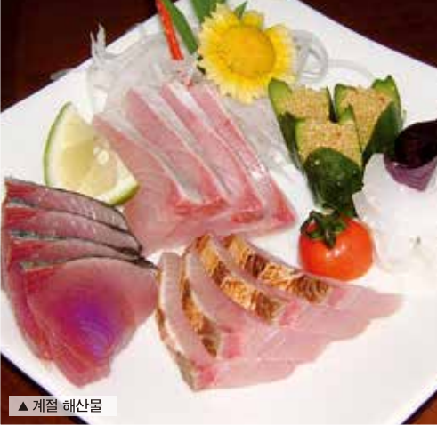
▲ 계절 해산물