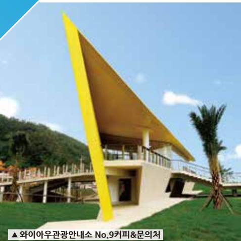
▲ 와이아우관광안내소 No.9커피&문의처

최근 관광여행 품질 향상을 위해 노란색 조형으로 유명한 와이아우 안내소에선 친절할 안내서비스를 제공하여 국내외 여행객에게 친절할 여행환경을 조성해 힘쓰고 있다.