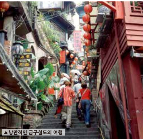
▲ 낭만적인 금광촌의 여행

과거 골드러시 마을이었던 이곳은 독특한 산악 마을 풍경으로 관광 명소로 탈바꿈했습니다. 산촌 풍광에 금광 관련 인물체험장으로 인기가 있다. 저우펀은 대만 유명 영화 「비정성서」 촬영지로도 꽤 유명하다. 계단식 오르막길, 옛찻집, 먹거리와 토산품 가게가 즐비하다. 진과스金瓜石는 황금박물관, 본산5호강도, 음양바다로 유명하다.